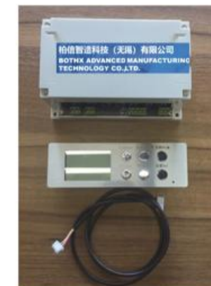
▲ 液晶层流罩控制器